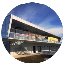
Sporthalle Buchholz, Uster