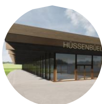
Sporthalle Hüssebühl, Hinwil